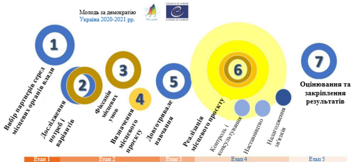
Головні етапи проєкту

керівниками, молодіжними працівниками, молодіжними лідерами, фахівцями в галузі освіти тощо), які візьмуть участь в довгостроковому навчальному процесі під керівництвом Ради Європи. Це навчання дозволить їм краще розвивати та реалізовувати місцеві програми або стратегії громадської участі для молоді. Також на етапі реалізації програми експерти Ради Європи будуть забезпечувати наставництво й консультації. Головні кроки цього процесу відображено на мал. 1.