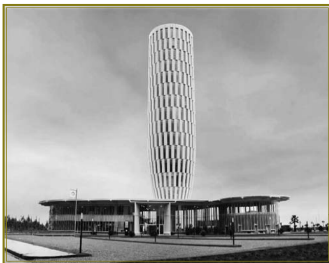
Прозорий офіс універсаму послуг грузинського зразка в м. Батумі

На виконання відповідного доручення Президента з листопада ще три такі «універсами послуг» мають бути відкриті в Києві, Кіровограді та Луганську. Як зазначає Олександр Черненко («Українська правда», 07.10.2011), «це такі спеціально облаштовані місця, куди громадянин може в зручний для нього час прийти, отримати всю необхідну інформацію, заповнити та здати відповідні документи, і врешті-решт отримати від органу влади потрібне йому/їй рішення або документ, – все це разом і називається адміністративною послугою. Такі центри створюються