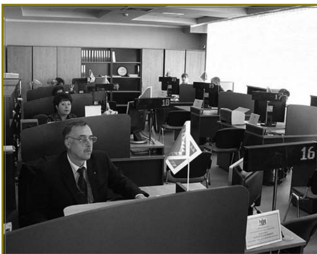
Зала надання послуг у «прозорому офісі» Вінницької міської ради

В Грузії широко запроваджується також електронний обмін необхідними документами. Громадянин, що