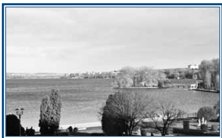
Схема екомережі допоможе зберегти та відновити зелені зони міста

Схему екомережі Тернополя розробили науковці кафедри геоекології Тернопільського національного педагогічного університету імені В.Гнатюка спільно з фахівцями управління житлово-комунального господарства, екології та благоустрою міськради.