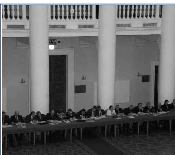
Конференція Асоціації міст України