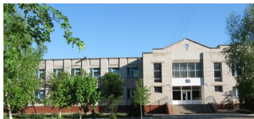
Комплексний проєкт з термомодернізації громадських будівель м. Запоріжжя