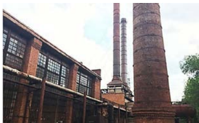
Модернізація системи теплопостачання м. Кривий Ріг

У підготовці та реалізації проєктів допомагає - Група управління і підтримки Програми (ГУПП)