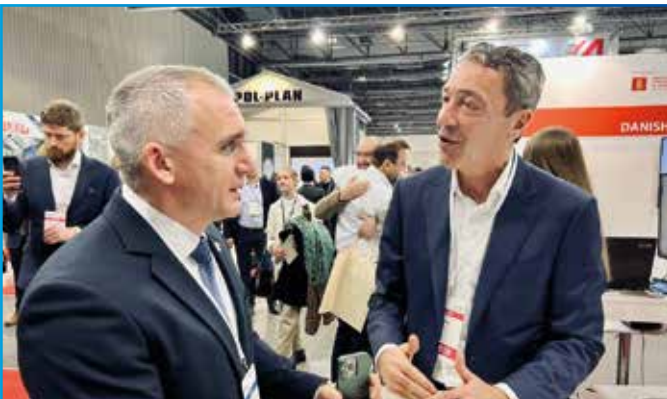
Період реалізації: 2022 р. – квітень 2023 р.

Під час нещодавнього візиту представників Уряду Королівства Данія до Миколаєва іноземні партнери вчергове підтвердили свою готовність підтримувати місто на шляху відбудови. Так, у місті планують відкрити офіс Посольства Данії в Україні, щоб робота була більш тісною та результативною. Крім того, Данія поглиблюватиме співпрацю та допомагатиме Миколаєву формувати стратегічні цілі розвитку, зокрема, шляхом участі в підготовці майстер-плану для відновлення міста. Експерти данської компанії Cowi підтримуватимуть технічну сторону розробки майстер-плану, при цьому відзначається, що увага буде спрямована на такі напрямки, як енергетика, вода, соціальна інфраструктура.