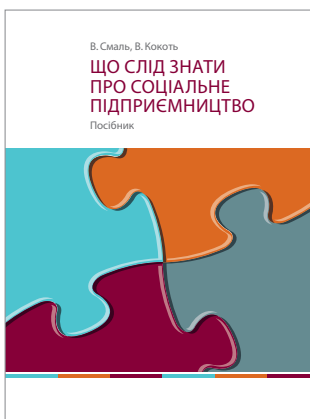
Посібник «Що слід знати про соціальне підприємництво»

У 2017 році Проект ПРОМІС випустив посібник «Що слід знати про соціальне підприємництво», де можна знайти всю необхідну теоретичну інформацію щодо особливостей соціального бізнесу, а також практичні приклади діяльності українських підприємств. Далі пропонуємо ознайомитися з іншими різноплановими ініціативами, які вже зараз можна назвати вагомим внеском у зростання соціального підприємництва в Україні.