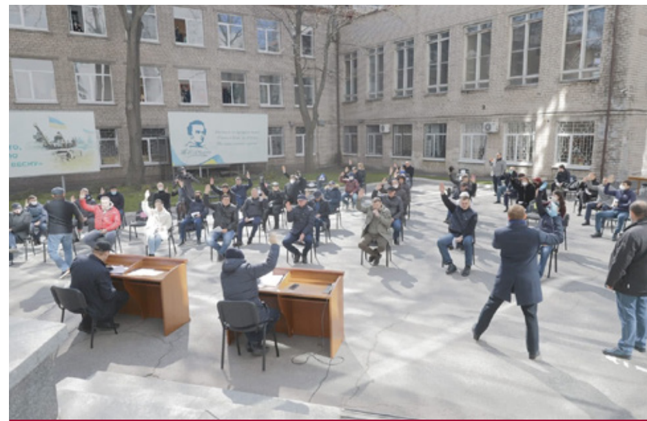
Дніпровська міська рада засідає у дворі через епідемію.

Проте є важливим перший досвід Дніпровської міської ради, яка 25 березня 2020 року спочатку провела звичайне засідання, де затвердила порядок денний і прийняла рішення №2/55 від 25 березня 2020 року «Про внесення змін до Регламенту Дніпровської міської ради VII скликання». Цим рішенням було передбачено проведення дистанційних засідань. Вказане рішення доступне на сайті міської ради. Потім міська рада після перерви провела дистанційне засідання в режимі відеоконференції. Відеозапис на YouTube доступний за посиланням https://youtu.be/u2xP6LHilLw .